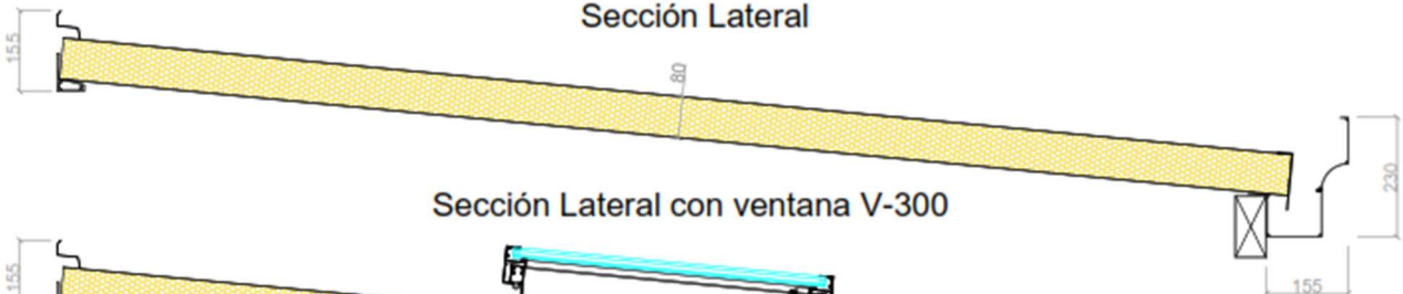
Sección Lateral con ventana V-300